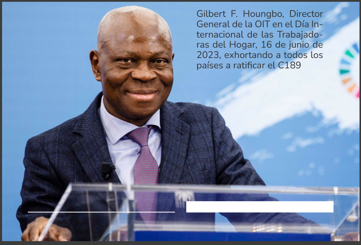
Gilbert F. Hougbo, Director General de la OIT en el Día Internacional de las Trabajadoras del Hogar, 16 de junio de 2023, exhortando a todos los países a ratificar el C189

¡No hay justicia social sin trabajo decente para las trabajadoras del hogar!