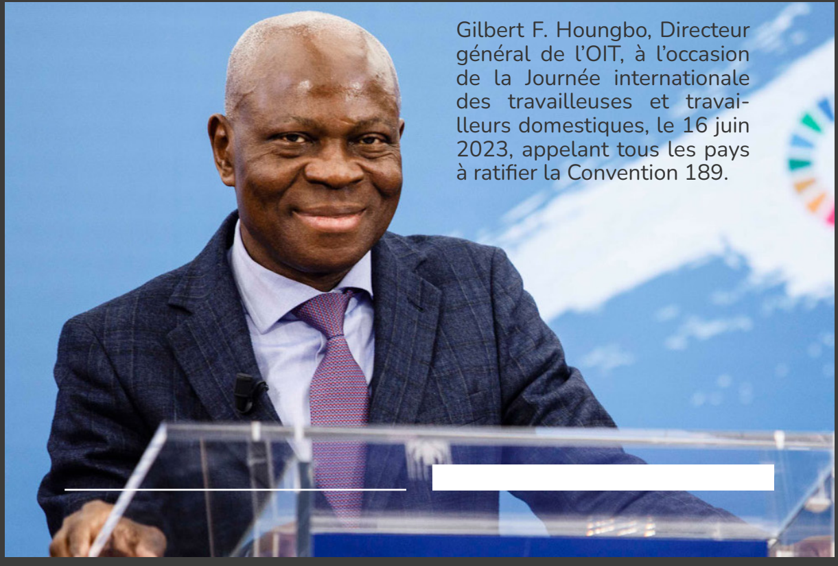
Gilbert F. Hougbo, Directeur général de l'OIT, à l'occasion de la Journée internationale des travailleuses et travailleurs domestiques, le 16 juin 2023, appelant tous les pays à ratifier la Convention 189.

Il n'y a pas de justice sociale sans travail décent pour les travailleurs domestiques !