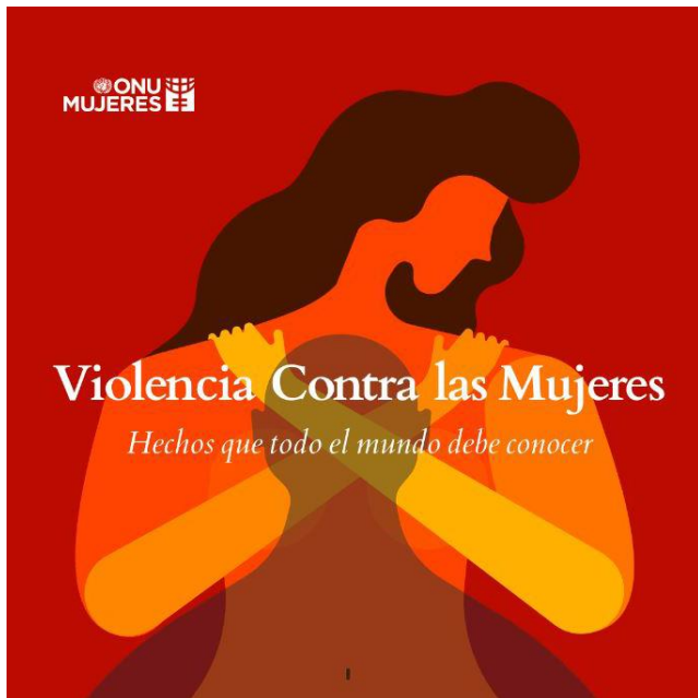
Día para la Eliminación de la Violencia de Género - ¿de qué se trata?