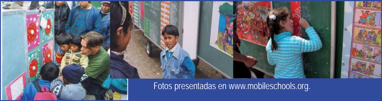
Fotos presentadas en www.mobileschools.org .